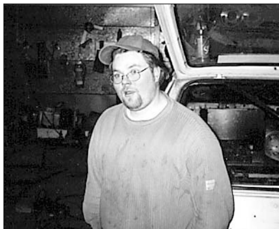
"En mä vaan tajua mikä siinä autossa oli. Ihan mä tein sen sääntöjen mukaan. Jos nyt oli väärä sivu sääntökirjassa niin kaikki on heti valittamassa."

Teamin autoissa oli hie-man laittomia virituksia ja